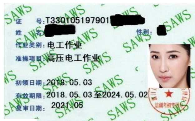
低压、高压证书样本